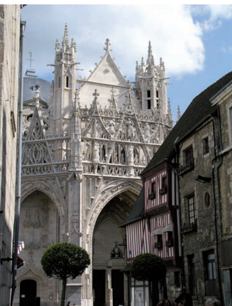
Alençon, (vue de l'église Notre-Dame) est le chef-lieu de l'Orne, un département essentiellement rural (48 hab/km 2 ).