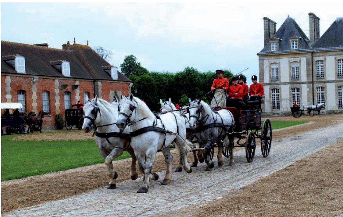
La Basse-Normandie est la première région d'élevage du cheval en France (plus de 7 500 élevages). Ici le Haras du pin, l'un des fleurons des haras nationaux.

trée du Très haut débit en milieu rural, conformément à la stratégie de la Région.